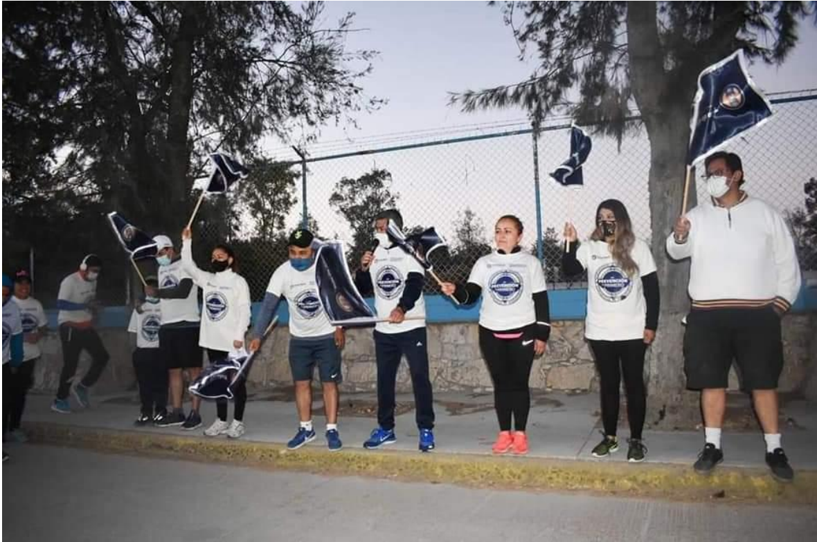
Asistencia a la presentación del Plan de Desarrollo Municipal.