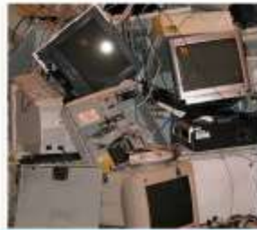
EQUIPO DE COMPUTO