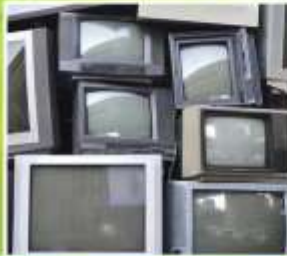
EQUIPO ELÉCTRICO Y ELECTRÓNICOS